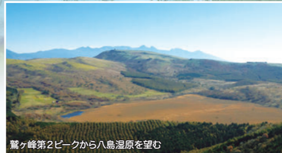
鷲ヶ峰第2ピークから八島湿原を望む

野鳥たちのさえずりが響く春の躍動感。亜高山植物が咲き乱れる眩しい夏。草紅葉に一面が染まる秋の鮮やかさ。アニマルトラッキングやスノーシューで純白の別世界を楽しむ冬。八島湿原は四季折々の輝きに出会える大自然のフィールドです。