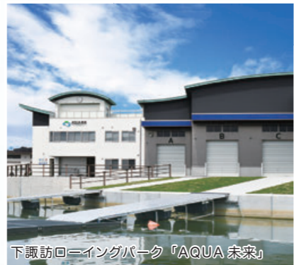
下諏訪ローイングパーク「AQUA 未来」