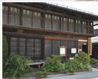
図 9:00~17:00 料 無料 月曜日と祝祭日の翌日、年末年始 TEL.0266-28-9229

かつて宿場の茶屋であった「松屋」を復元した建物。アララギ派の女性短歌結社「明日香」の編集所としても使われた当時の面影を偲ばせています。