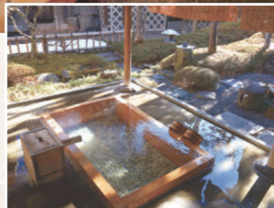
みなとや旅館 露天風呂