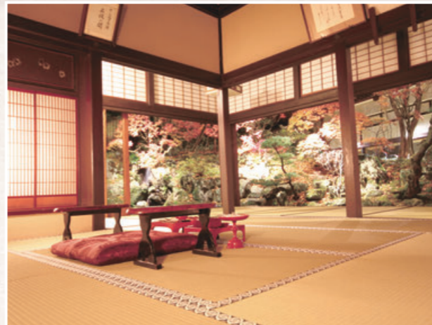
聴泉閣かめや(上段の間)

綿の湯、兎湯、旦過の湯... 中山道で唯一の温泉宿場として 幾多の旅人や文人墨客を迎えてきた 歴史のある名湯・下諏訪温泉。 人々を温かくお迎えしたおもてなしと ゆったりとした湯治場の風情が残る 「いで湯」の里です。