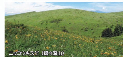
ニッコウキスゲ（蝶々深山）