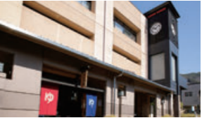
図 9:00~17:00 (12月~2月 9:30~16:30) 図 年中無休(臨時休館の場合有) 料 大人600円、小中学生300円(税込) ※団体割引有 図 TEL.0266-27-0001 地図-B2