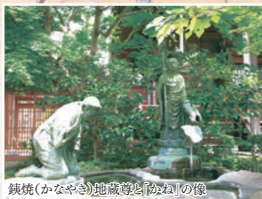
鏡焼(かなやき)地藏尊の像