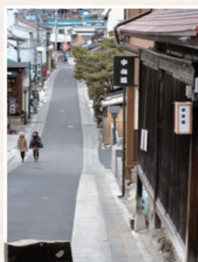
宿場の風情が今も残る湯田坂

図 9:00~17:00 料 無料 月曜日と祝祭日の翌日、年末年始 TEL.0266-27-3441