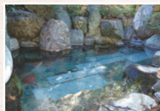
旅館 奴 露天風呂