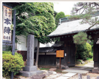
図 9:00~17:00 料 無料 月曜日と祝祭日の翌日、年末年始 TEL.0266-27-8827

江戸時代の宿場民家を保存する資料館。宿場関係を中心に街道、温泉などの貴重な歴史民俗資料が保存・展示され、当時の様子をすることができます。