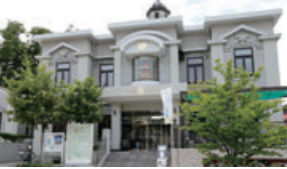
図 9:00~17:00 (8月 9:00~17:30) 図 月曜日(祭日の場合翌火曜日) 8月は無休 料 大人1,000円、小中学生500円(税込) ※団体割引有 図 TEL.0266-26-7300 地図-C2