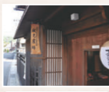
図 9:00~17:00 料 無料 月曜日と祝祭日の翌日、年末年始 TEL.0266-27-3441

伏見屋邸は二八六四年(元治元年)の建築と推定される木造二階建ての旧商家。復元修理し、まち歩きを楽しむ観光客の休憩や住民の交流の場として開設しました。