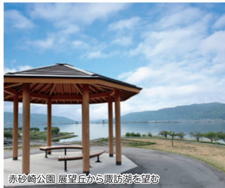
赤砂崎公園 展望丘から諏訪湖を望む