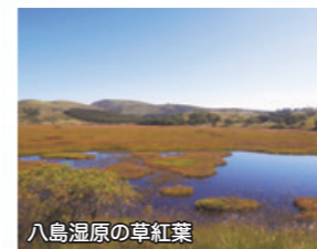
八島湿原の草紅葉