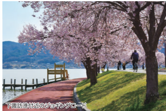
下諏訪港付近のジョギングロード