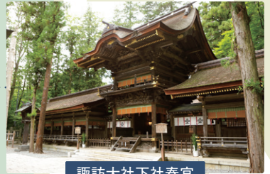
諏訪大社下社春宮