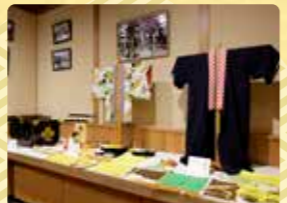
※駐車場はありません。