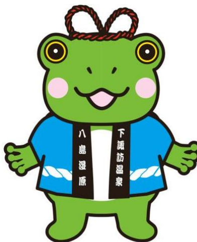
下諏訪観光PRキャラクター やしまる

このマニュアルは、下諏訪観光PRキャラクター「万治くん」「やしまる」デザイン使用取扱要領をわかり易くした物です。要領と合わせてご確認ください。