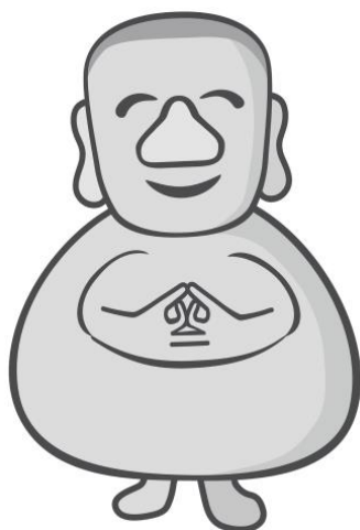
下諏訪観光PRキャラクター 万治くん